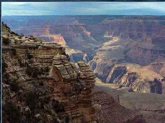
Les États sud-ouest des États-Unis offrent autant de lieux de pêche que de sites grandioses à visiter, comme le Grand Canyon.

Tracker depuis la ville de Page, à l'extrémité du lac. Les points d'accès au lac sont assez nombreux mais pas évidents à trouver ; une bonne carte de la zone est nécessaire. Certains sont des pistes et il vaut mieux avoir un véhicule tout terrain pour s'en approcher. Il faut également faire attention où l'on met les pieds, car ces terrains sont des zones fréquentées