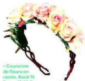
> Couronne de fleurs en rami, Rock 'N Rose, 47,22 €.