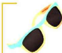
> Lunettes de soleil en bois, Waiting for the Sun, 140 €.

Le culte du corps sain a également gagné les villes, San Francisco et Los Angeles en tête. Après des années de culturisme et de bronzage à outrance, la routine beauté des Californiens mise sur plus de naturel. L'objectif ? Une alimentation saine, principalement végétale, avec des cures détox, plus ou moins folles. Surf, soleil et fruits exotiques, telle est la recette du nouveau rêve américain. ●