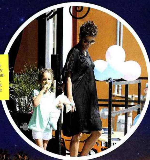
HALLE BERRY Elle fait partie des stars qui n'hésitent pas à venir se taper la cloche en famille chez Fig & Olive.

Pour rencontrer du people, on prend la direction du 8490 Melrose Pl, West Hollywood. Chez Fig & Olive, on peut partager une table avec le gratin d'Hollywood. Hilary Duff, Bradley Cooper, Halle Berry, Ryan Gosling et Jessica Simpson font partie des habitués. Pour se taper un vrai burger à l'Américaine, on pousse les portes du In-N-Out Burger le plus proche. C'est sans conteste le fast-food idéal pour se régaler sans exploser son portefeuille.