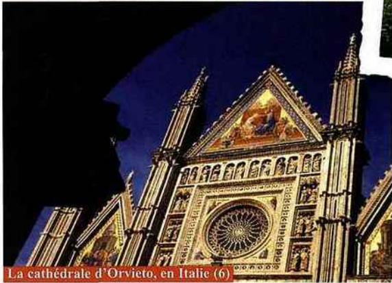
La cathédrale d'Orvieto, en Italie (6)