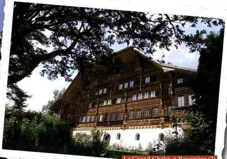
Le Grand Chalet, à Rossinière (2)