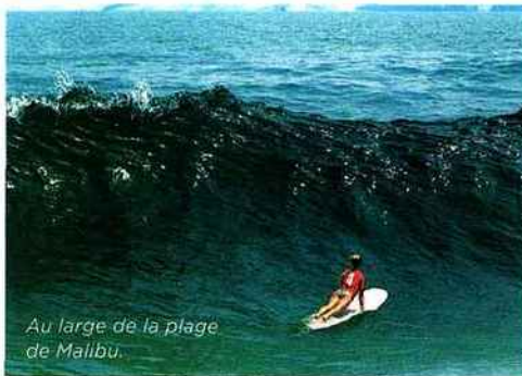
Au large de la plage de Malibu.