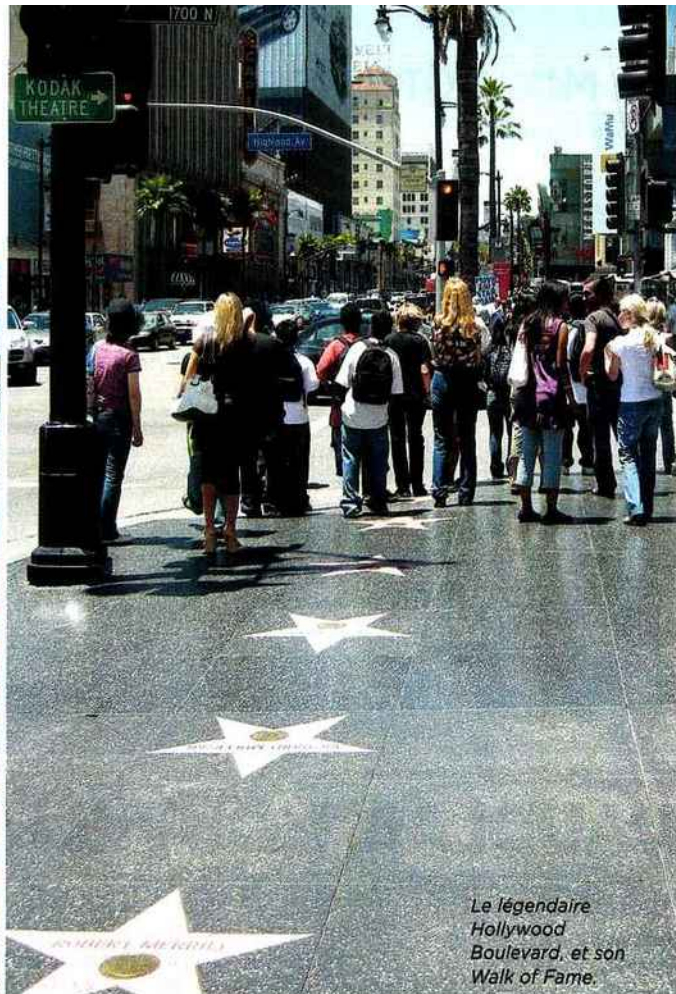
Le légendaire Hollywood Boulevard, et son Walk of Fame.