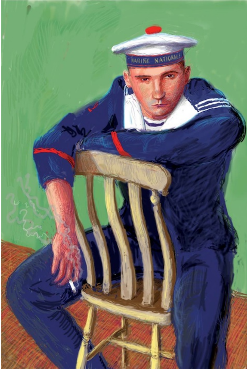
David Hockney, A Bigger Matelot