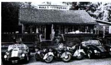
Alice's restaurant : motos et belles bagnoles