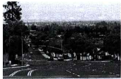
Vue globale de la Silicon Valley

"N'oubliez jamais qu'ici tout va très vite. On ne perd pas de temps. Si vous n'avez pas finalisé votre offre, ils vous laisseront peu de temps pour le faire. On parle d'argent dès la première rencontre, de contrats à la seconde et de production concrète à la troisième". Si le rythme est trop rapide ! Tant pis pour vous. Enfin, n'oubliez jamais qu'il y a une forte population d'origine asiatique qui a su garder ses traditions. C'est important à savoir pour ne pas commettre d'impairs. Ici aussi, les cartes de visite se présentent à deux mains !