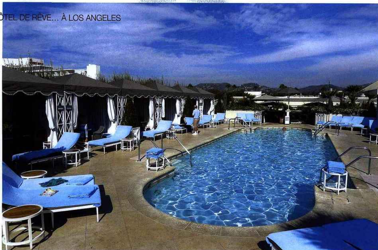
Ci-dessus : Douze cabines privées autour de la piscine de l'hôtel Peninsula Beverly Hills s'offrent à ses clients

ment C'est le seul restaurant « AAA Five Diamond » du Sud de la Californie depuis dix-huit ans consécutifs Ils propose une cuisine américaine moderne et peut servir jusqu'à cent couverts