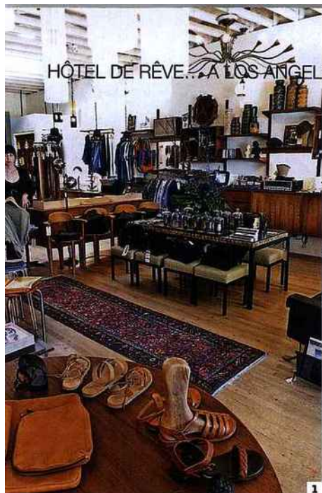
HÔTEL DE RÊVE... A LOS ANGELES