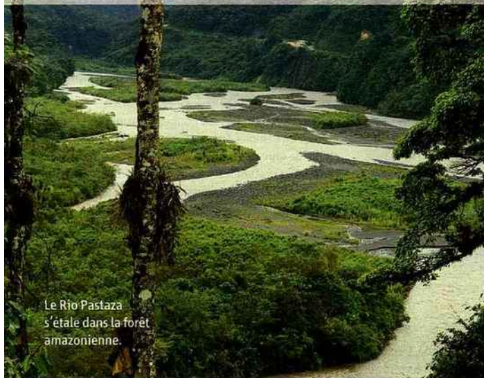
Le Rio Pastaza s'étale dans la forêt amazonienne.

vibrer. En ce début d'année, ils nous confient leurs destinations favorites. PAR EMMANUELLE COURRÈGES