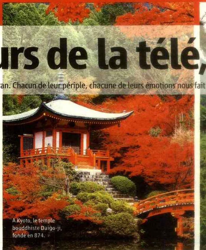
A Kyoto, le temple bouddhiste Daigo-ji, fondé en 874.