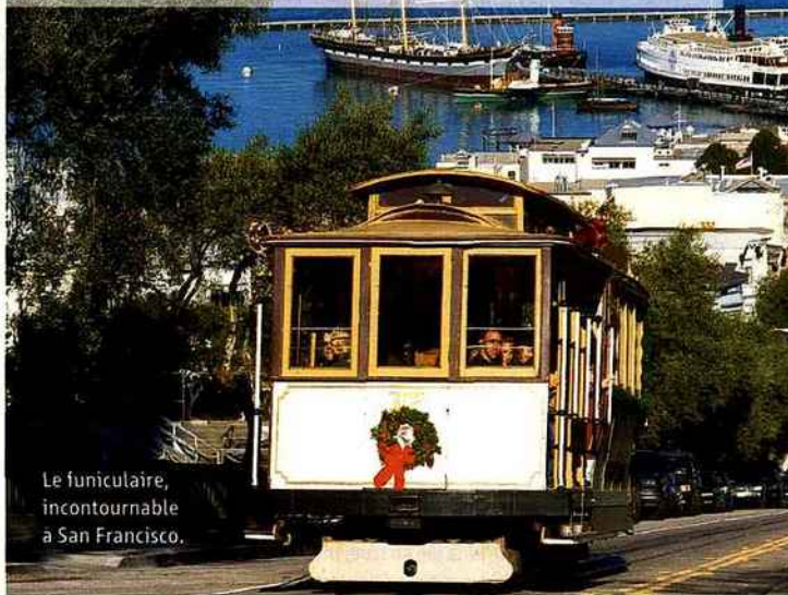
Le funiculaire, incontournable à San Francisco.