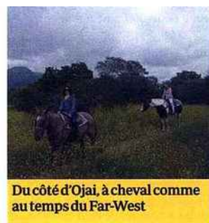
Du côté d'Ojai, à cheval comme au temps du Far-West