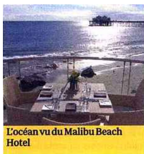
L'océan vu du Malibu Beach Hotel

Les anciens bâtiments ocre d'adobe, restaurés et aménagés, sont depuis belle lurette devenus centre touristique, avec restaurants à tortillas, boutiques de souvenirs et marchands de sombreros. Face au pueblo, reste la belle gare d'Union Station, chef-d'œuvre Art déco construite en 1939. Sur Hollywood Boulevard, le parcours rituel débute devant le Mann Chinese Theater, l'ahurissant cinéma en forme de pagode. Lieu des grandes premières hollywoodiennes, le trottoir du Chinese Theater conserve les traces des empreintes de toutes les gloires du cinéma d'hier et d'aujourd'hui, y