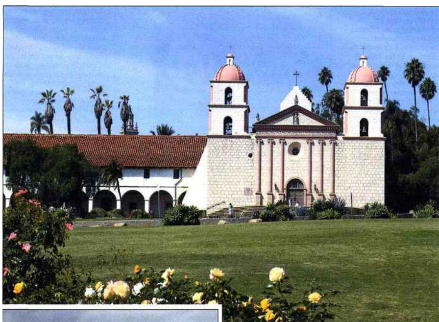
À Santa Barbara, la Reine des Missions

LE PASSAGE OBLIGÉ dans la Cité des anges ne manque pas d'attraits, malgré la démesure et l'extravagance de cette ville de plus de 14 millions d'habitants. Dans les rues calmes de Beverly Hills et les allées de Bel Air où nichent les stars, la concentration des Phoenix Canariensis, ces palmiers élancés d'une hauteur souvent vertigineuse, est phénoménale. Dans la partie nord de Main Street, on retrouve l'héritage hispanique de ce que fut El Pueblo de Nuestra Señora la Reina de los Angeles, la petite mission espagnole qui a donné son nom à la ville.