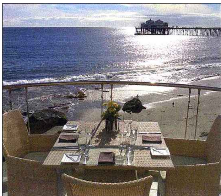
L'océan vu du Malibu Beach Hotel