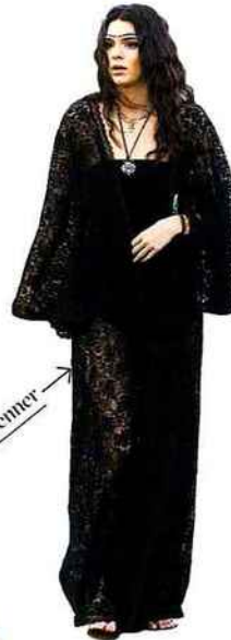
Kylie Jenner →