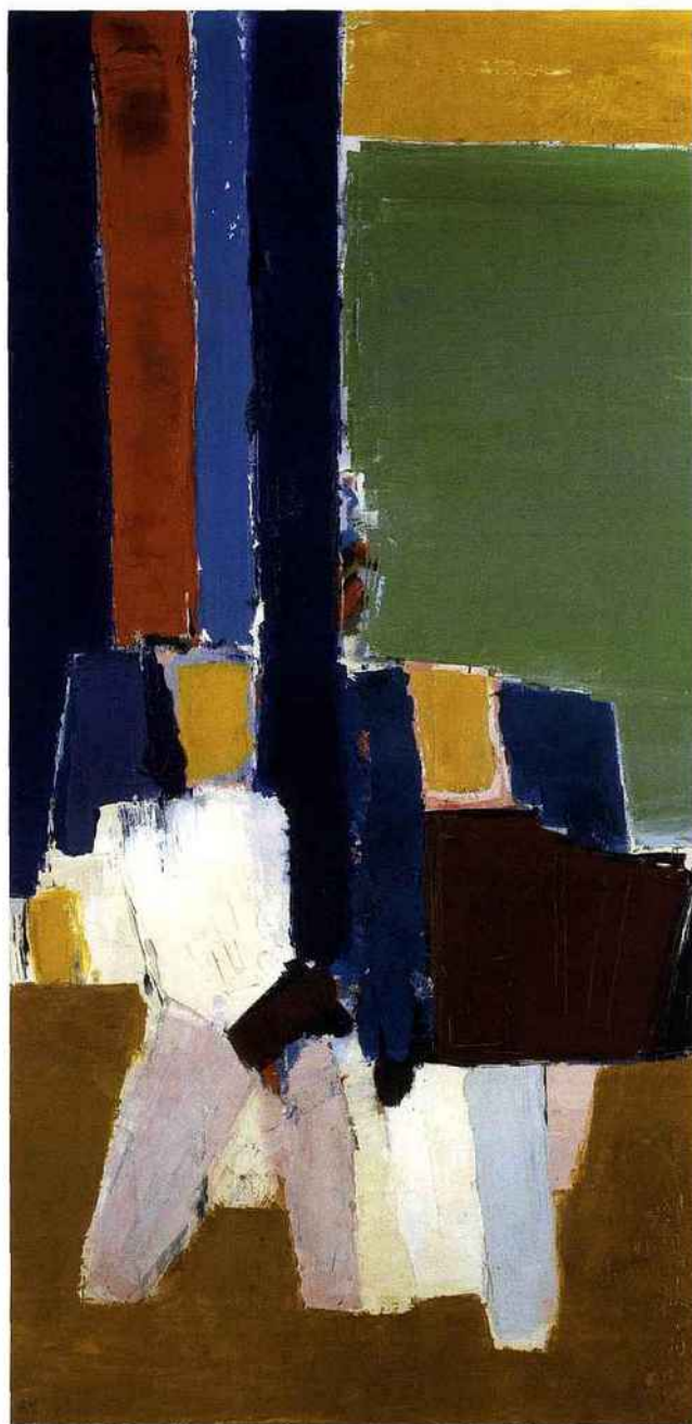
© Les Toiles, huile sur isopex, 1952