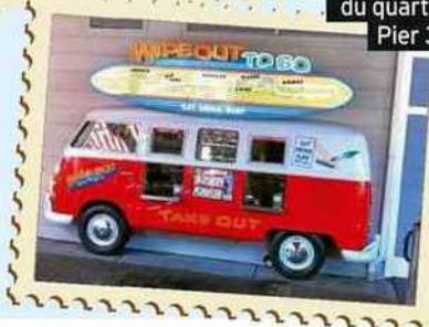
Un restaurant du quartier Pier 39.

de déguster une tartine de brioche recouverte de crabe (environ 10 $/7,50 €) ou une soupe de palourdes (environ 8 $/6 €, chez Boudin).