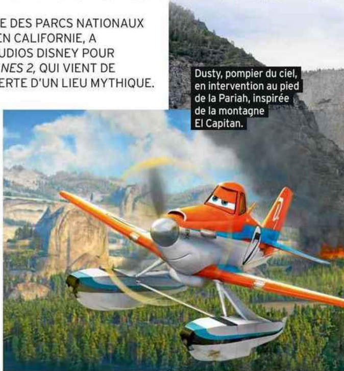
Dusty, pompier du ciel, en intervention au pied de la Pariah, inspirée de la montagne El Capitan.

Une fois arrivé dans cette ville sortie de terre après la première ruée vers l'or, oubliez l'idée de rejoindre Yosemite en diligence, comme cela se faisait vers 1860... Préférez la voiture pour parcourir les 60 kilomètres qui vous séparent d'une forêt XXL, des ours noirs, daims, aigles à tête blanche, écureuils... Il y a 150 ans, le 30 juin 1864, le Président Abraham Lincoln la déclara parc national. Après avoir payé 20 $ (15 €/par voiture) pour le droit d'entrée, valable pendant 7 jours, vous pouvez dormir dans un lodge (à partir de 60 $/45 € dès le mois de septembre), faire du camping (zones définies), de la randonnée, de la pêche, du vélo, de l'équitation... Les possibilités sont nombreuses! Le plus simple, avant votre départ, est de faire un tour sur le site www.nps.gov/yose , car il faut bien garder à l'esprit que