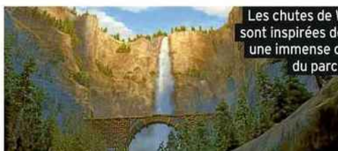
Les chutes de Whitewall du film sont inspirées de la Bridalveil Fall, une immense cascade au cœur du parc national.