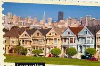
Le quartier Haight-Ashbury.