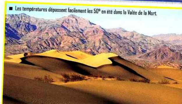
■ Les températures dépassent facilement les 50° en été dans la Vallée de la Mort.