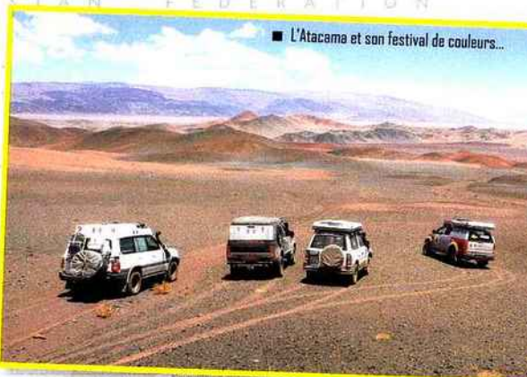
■ L'Atacama et son festival de couleurs...

Ces trois déserts représentatifs du continent américain se visitent en 4x4 de location, ou avec son propre 4x4, en sécurité à toutes saisons sauf en plein été. ■