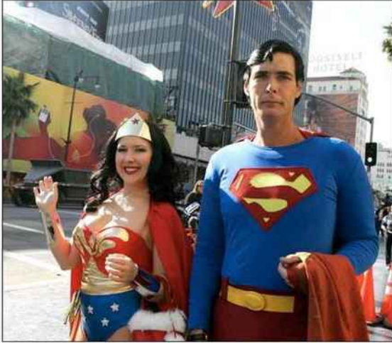
■ Avant d'aller voir les Lakers de Los Angeles, les super-héros d'Hollywood Boulevard se font prendre en photo pour un dollar.