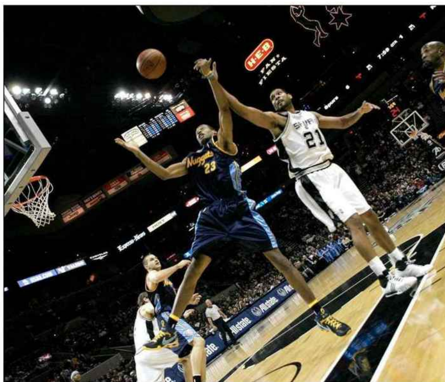
■ Et sur les parquets, comme ici chez les San Antonio Spurs, la bataille fait rage.