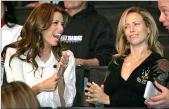
■ En 2007, l'actrice Eva Longoria rencontrait la chanteuse Sheryl Crow dans les gradins du Staples Center de Los Angeles