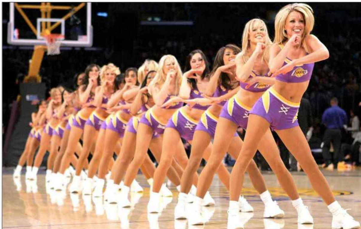
■ Aux États-Unis, d'une salle de basket-ball à l'autre, les rencontres sont aussi l'occasion pour les cheerleaders d'exhiber leurs talents.