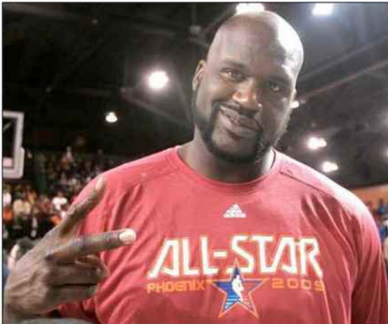
■ Shaquille O'Neal, surnommé Shaq, est l'un des meilleurs joueurs de l'histoire du basket-ball. Il chausse du 50 !