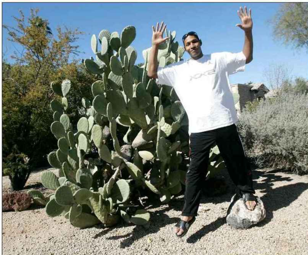
■ Rencontré à Phoenix en 2009 lors du All Star Game, le Français Boris Diaw évolue depuis trois saisons chez les Spurs avec son ami TP. Il est attaché à la Franche-Comté car sa mère est née à Besançon.