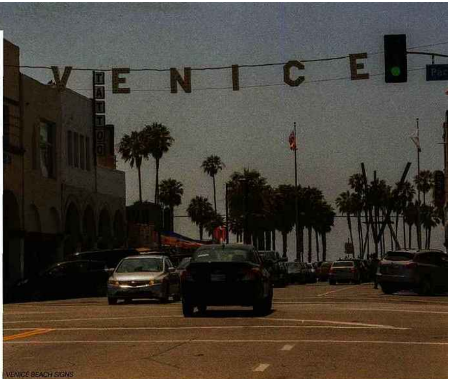
VENICE BEACH SIGNS

l'autre plage emblématique de Los Angeles, se trouve celle de Santa Monica. À voir pour sa digue, la Santa Monica Pier, fameuse pour sa grande roue et ses montagnes russes, mais la plage est loin d'être la plus belle de la côte, n'y consacrez pas une journée entière.