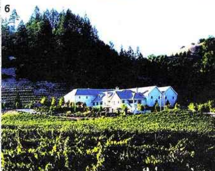
Vignobles Peter Michael, Jack London Park, Healdsburg, Sonoma County, Californie

Au cœur de la Sonoma Valley, en Californie , une poignée de vignerons élaborent de petits bijoux, aussi rares que méconnus en France.