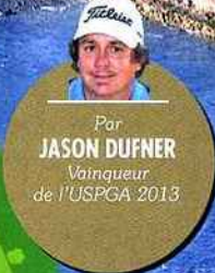
Par JASON DUFNER Vainqueur de l'USPGA 2013

A savoir : ce club a reçu 5 éditions de l'US Open et reçoit l'AT&T Pebble Beach National Pro-Am depuis 1947.