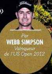
Par WEBB SIMPSON Vainqueur de l'US Open 2012

mosphère était électrique – on est en Californie – et les abords du green étaient devenus un véritable amphithéâtre. Les spectateurs étaient très bruyants, c'était fantastique, je n'oublierai jamais ce moment. Je me souviens alors d'avoir dit à mon caddie, Paul Tesori, que depuis le trou n° 10, je ne sentais même plus mes jambes!