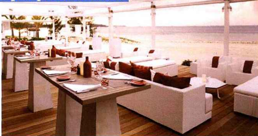
Beach Rouge, le bar-restaurant de plage ↑ de l'hôtel Lux* Belle Mare sur l'île Maurice.