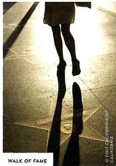
WALK OF FAME