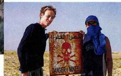
No man's land miné, entre le Sahara occidental et la Mauritanie.

“LE VOYAGE AU LONG COURS AGIT COMME UN CATALYSEUR D'ÉMOTIONS ET CONFORTE DANS LE CHOIX DE L'EFFORT JUSTE.”