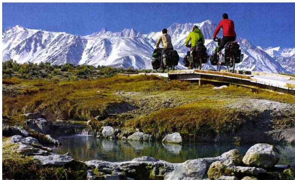
La chaîne de la Sierra Nevada en Californie offre un décor splendide le long de la Highway 395.

“LE VOYAGE AU LONG COURS AGIT COMME UN CATALYSEUR D'ÉMOTIONS ET CONFORTE DANS LE CHOIX DE L'EFFORT JUSTE.”