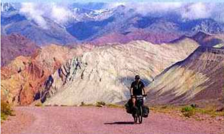
La vallée de Kekemeren au Kirghizstan offre un panel de couleurs complet.