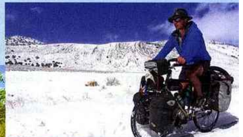
La sortie de la vallée de la Mort, en Californie , est rendue difficile par un col enneigé.