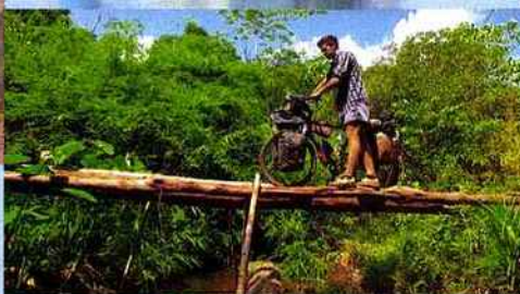
Un pont rudimentaire sert d'accès aux sentiers des monts Cardamomes, au Cambodge.