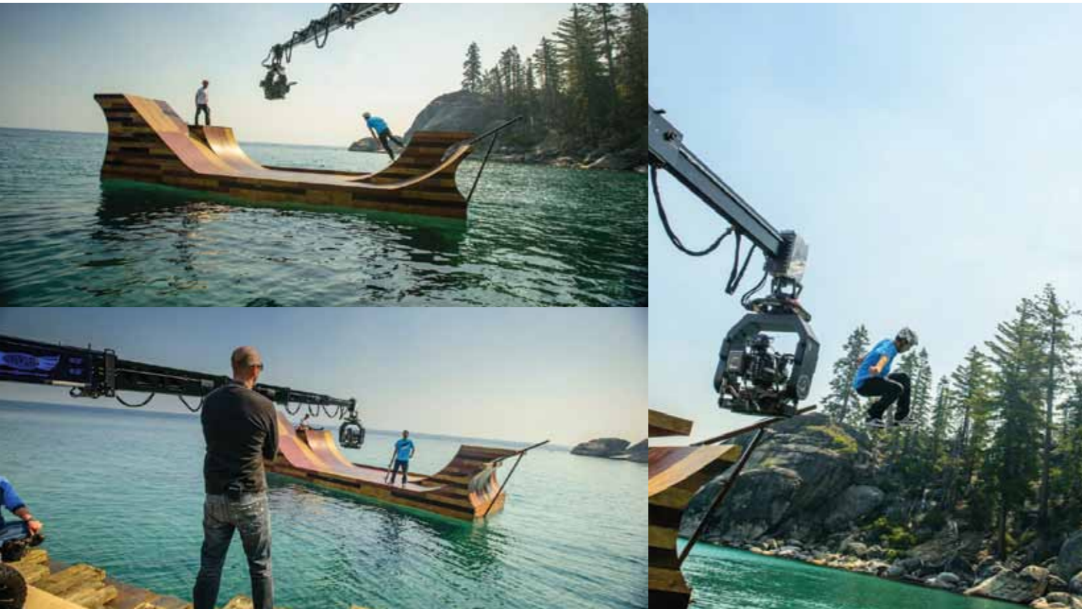
© Bob Bumquist floating skateramp by Jerry Blohm and Jeff King for Visit California. http://media.visitcalifornia.com