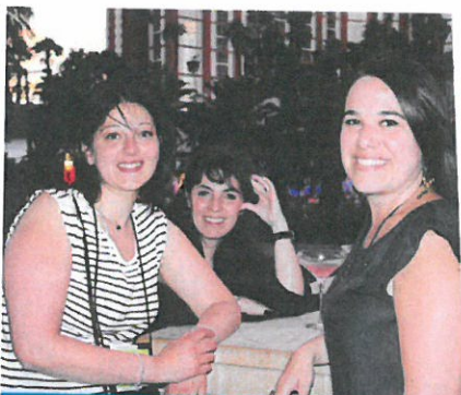
Des représentantes de TO français à la soirée organisée par la ville de New York au Palazzo dont le bar Lavo est ouvert sur le Strip...