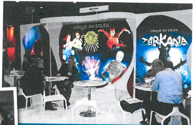
Avec huit spectacles permanents, le Cirque du Soleil est une véritable institution à Las Vegas !

la soirée de San Francisco, l'exubérant Caesar's Palace pour la clôture et son feu d'artifice lancé par Céline Dion en personne... En plus, la délégation française, la plus importante depuis 10 ans, s'est retrouvée au traditionnel cocktail du Visit USA Committee organisé cette année dans les jardins du Tropicana. ■