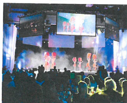
Pas le temps de s'ennuyer durant les déjeuners : danses, chants et extraits de comédies musicales.